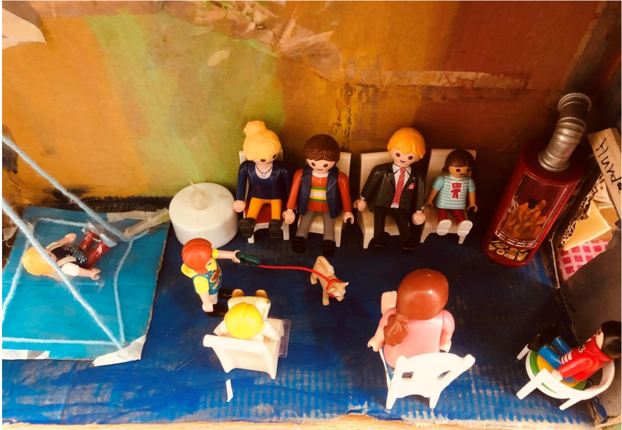
In unserer Schule der Zukunft soll es auch ein Lehrerzimmer geben, allerdings für die Kinder.